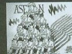
Dionisio Buccat III (ikalawang gantimpala, Tumbok )